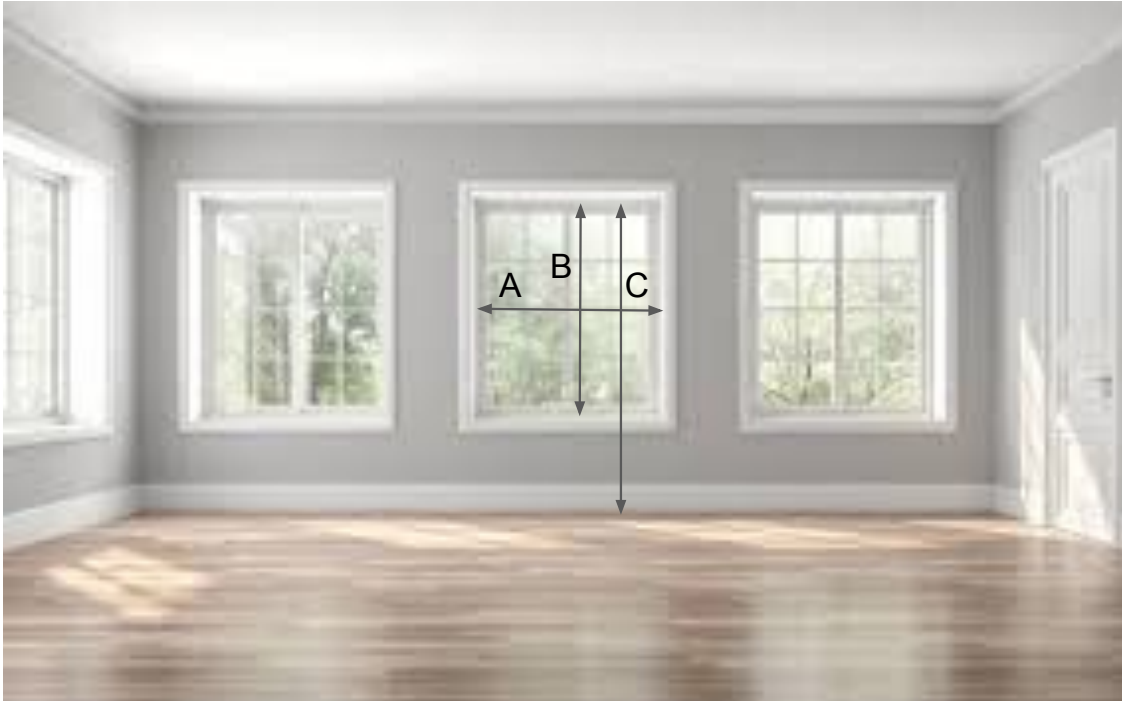
Liftgardin montert inni vindusnisje